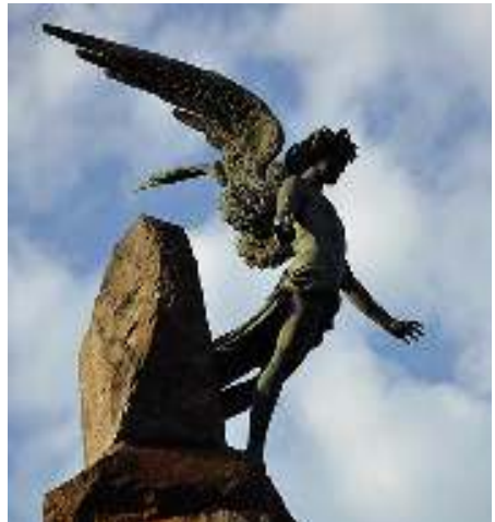
Trafo del Frejus 1879 Torino

Monumento alegórico a la construcción del túnel de Frejus. Tradicionalmente recuerda al sufrimiento de los mineros que trabajaron en él