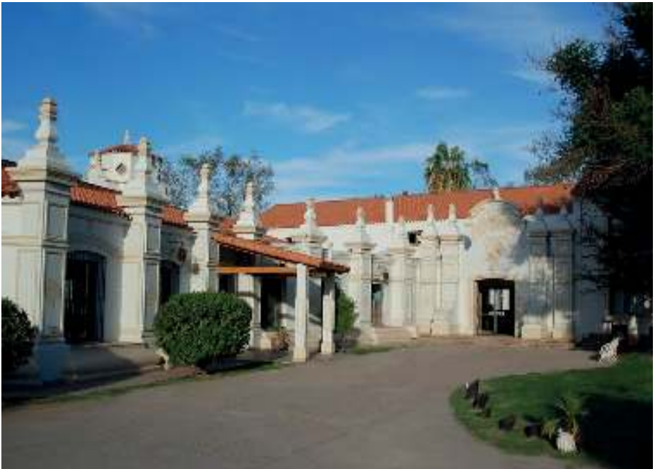
Complejo Hotel Savoia Guaymallén, Mendoza

El domingo cerraremos con la Santa Misa y la participación de los coros