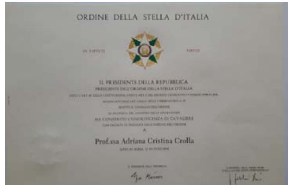
Certificado Ordine della Stella d'Italia

La Orden consta de cinco grados: Cavaliere - Ufficiale - Commendatore - Grande Ufficiale - Cavaliere di Gran Croce. Y en casos excepcionales los Cavalieri di Gran Croce pueden acceder a la condecoración de Gran Cordone dell’Ordine. Las distinciones se confieren semestralmente en las dos fechas más relevan-