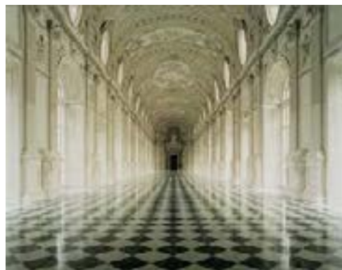
Salones Venaria Reale