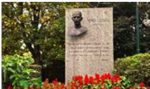
Monumento y tumba del poeta Nino Costa

El poeta Giovanni Costa, Nino Costa, nació en Torino el 28 de junio de 1886 y murió el 6 de noviembre de 1945, en la misma ciudad.