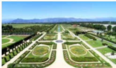
Jardines Venaria Reale

El conjunto arquitectónico comprende el parque y el burgo histórico de Venaria, construido a modo de una especie de collana que evoca a la Santísima Anunciada, símbolo de la casa saboyana. Después de la destrucción de los franceses en 1693, Víctor Amadeo II ordenó su restauración de acuerdo con los cánones franceses. Los trabajos continuaron durante el siglo XVIII (cuando se agrega la iglesia de San Uberto, encastrada entre los palacios) y principios del XIX. Con el fin de las guerras napoleónicas, que habían transformado el complejo en barracas, las instalaciones fueron cedidas al ejército que mantuvo esa finalidad hasta