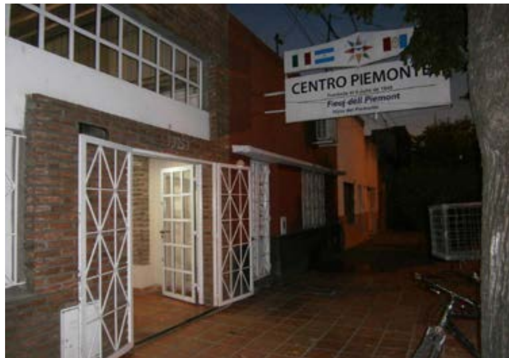
Fachada Centro Piemontés

A lo largo de sus setenta años, el Centro Piemontés ha realizado múltiples actividades relacionadas con la colectividad italiana y abiertas a la comunidad santafesina. A las clases de idioma italiano y práctica de la lengua piemontesa, se han ido sumando las clases de cocina, la práctica de disciplinas orientales, como el yoga, taekwondo y tai ji quan, pilates, tiro al blanco con arco, danzas tradicionales italianas y modernas, talleres literarios para niños, talleres de costura, telar y pintura